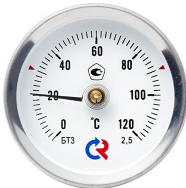
Рисунок 1.3 – Механический термометр

температурными коэффициентами расширения. Чувствительным элементом является латунная трубка 1 с находящимися внутри нее пружинами 2 из инвара. Это приводит к уменьшению зазора a , устанавливаемого при наладке в зависимости от необходимого значения сигнализируемой температуры.