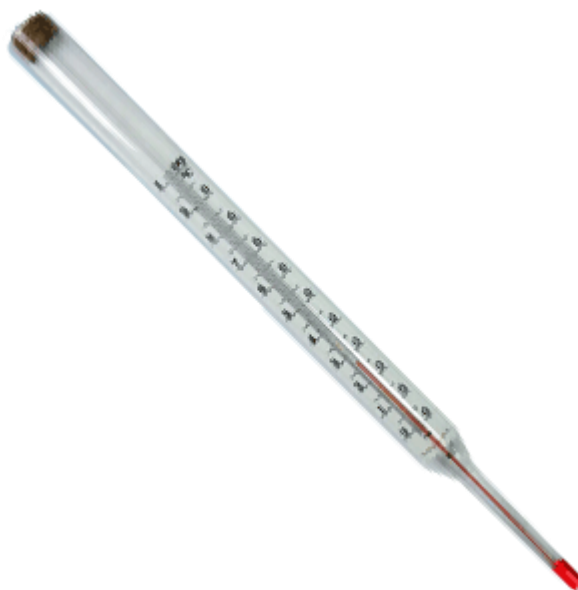
Рисунок 1.2 – Жидкостный термометр

(старению), устраняющей смещение нулевой точки шкалы, связанное с многократным повторением нагрева и охлаждения термометра (поправку на смещение нуля шкалы необходимо вводить при точных измерениях). Точность жидкостного термометра определяется ценой делений его шкалы. Для обеспечения требуемой точности и удобства применения пользуются жидкостными термометрами с укороченной шкалой; наиболее точные из них имеют на шкале точку 0^{\circ}\text{C} независимо от нанесённого на ней температурного интервала. Точность измерений зависит от глубины погружения жидкостного термометра в измеряемую среду. Погружать жидкостный термометр следует до отсчитываемого деления шкалы или до специально нанесённой на шкале черты. Если это невозможно, следует вводить температурную поправку на выступающий столбик.