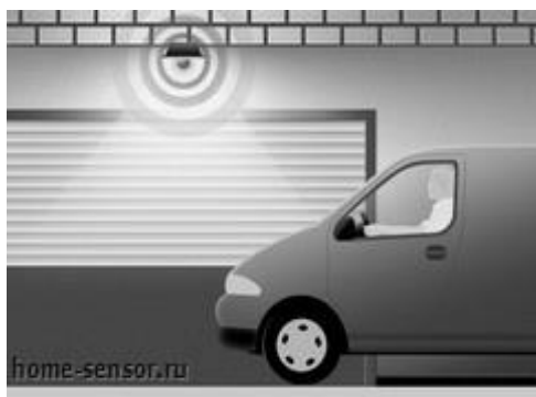
(Рисунок 8 – датчик освещения перед воротами гаража)

Для освещения больших уличных пространств лучше всего подходят прожекторы с датчиками движения. Прожектор подбирается, исходя из требуемой мощности (т.е., необходимой яркости освещения), и крепится на достаточной высоте (2-5 метров) вблизи стоянки автомобиля. Датчик движения устанавливается на среднюю или минимальную чувствительность (предотвращая дневные включения) и максимальный период включения (10-15 минут). При фиксации движения на территории стоянки (перемещение автомобиля или человека), датчик будет включать прожектор на указанный период времени. Немаловажным дополнением такого применения датчика движения является вопрос безопасности: в темное время суток датчик будет включать достаточно яркое освещение при появлении любого человека на автомобильной стоянке, что может отпугнуть незваных гостей и автомобильных воров (Рисунок 8).