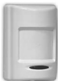
(Рисунок 1 – датчик движения)