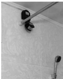
(Рисунок 5 – датчик движения в ванной комнате)

В ванной комнате устанавливается непрерывно включенный и экономичный ночник, поддерживающий постоянный, но низкий уровень освещения (Рисунок 5). Датчик движения (для этих целей лучше всего подходит датчик с углом обзора 360 градусов) крепится на потолке помещения. Перед входом в ванную комнату устанавливается традиционный выключатель света. Как только Вы входите в ванную комнату для того, чтобы помыть руки - на несколько минут включается свет. Если Вы хотите принять ванну и рассчитываете находиться в помещении продолжительное время, Вы просто включаете свет перед тем как войти. Если Вы забудете это сделать - датчик движения включит освещение в ванной комнате на установленный период (например, 10 минут), но после выключения света Вы не окажетесь в полной темноте - Вам поможет постоянно включенный ночник, а снова включить освещение Вы сможете, например, взмахнув рукой.