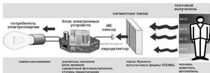
(Рисунок 2 – принцип работы датчика)