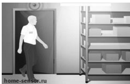
(Рисунок 7 – освещение в помещении)

Главный датчик движения устанавливается над дверью в помещение или немного сбоку, в зависимости от планировки конкретного помещения. Осветительные приборы возле двери устанавливаются в любом удобном месте. В зависимости от размера помещения, его планировки, наличия стеллажей, в помещении ставятся дополнительные датчики движения, охватывающие все части помещения. Датчики движения устанавливаются на максимальный интервал включения освещения (10-15 минут, в зависимости от модели), а их "порог срабатывания" выбирается в зависимости от постоянного уровня освещенности помещения (например, в помещениях без окон можно установить максимальную чувствительность датчика, а в комнатах с естественным освещением - среднюю или минимальную). Теперь, при появлении человека в помещении, освещение будет включаться на 10-15 минут. Если человеку потребуется больше времени - достаточно, например, взмахнуть рукой, и датчик снова среагирует и включит свет. Если в помещении имеются стеллажи или оно делится на несколько комнат, дополнительные датчики помогут человеку постоянно находиться в освещенной зоне (Рисунок 7).