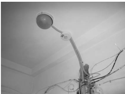
(Рисунок 6 – Датчик движения на лестничной площадке)

В многоэтажном доме схема установки освещения делается подобно двухэтажному варианту для каждого лестничного пролета, то есть для лестницы на 3 этажа понадобится 2 датчика, для 4-х этажей - 3 датчика и так далее. Таким образом, при фиксировании движения на любом участке лестницы, соответствующий датчик движения будет включать освещение над этим участком и позволит Вам подниматься и спускаться по полностью освещенной лестнице, не заботясь о включении света.