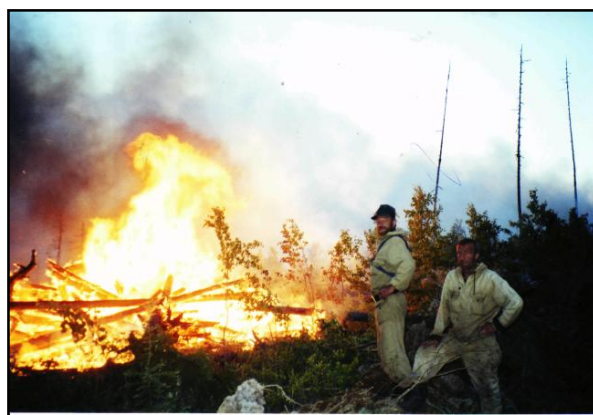
Пожар в п.Горки 20 сентября 1998 г. 38