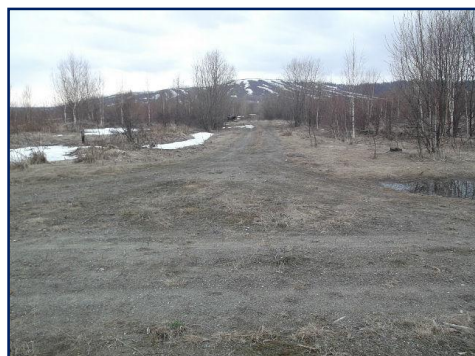
Дорога в посёлок 18

было увидеть, пока не поднимешься на горочку и лишь тогда, перед взглядом расстился весь посёлок, окаймлённый сопками. Посёлок состоял из 8 улиц: Восточная, Лесная, Нагорная, Октябрьская, Северная, Советская, Школьная и Школьный переулок.