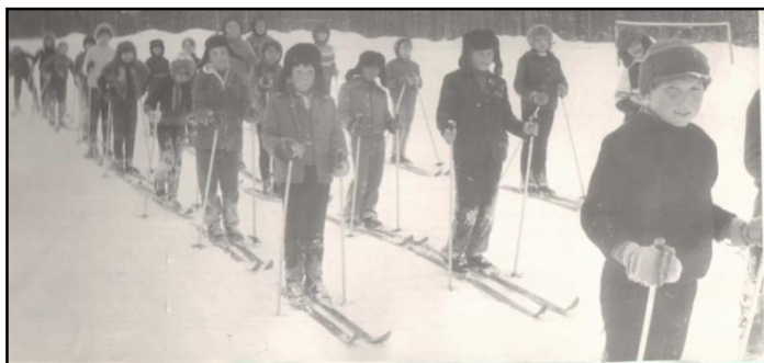
Горкинская лыжная школа 35