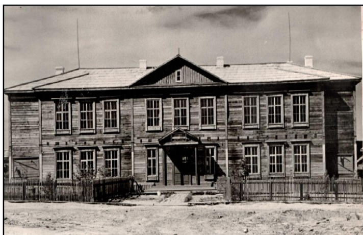
Горшинская школа 13 .

Первый магазин в п. Горки появился сразу же, как бригады СМУ начали строительство. Его открыли в 2-х квартирном доме.