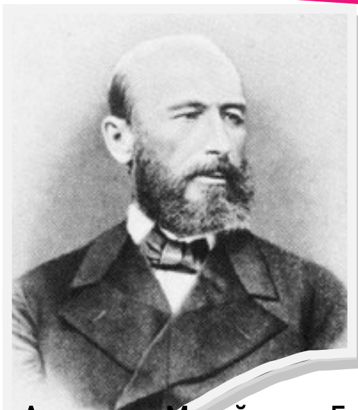
Александр Михайлович Бутлеров

Много сил отнимала у Бутлерова борьба за признание Академией наук заслуг русских учёных. В 1882 в связи с академическими выборами Бутлеров обратился непосредственно к общественному мнению, опубликовав в московской газете «Русь» обличительную статью «Русская или только Императорская Академия наук в Санкт-Петербурге?». Бутлеров был поборником высшего образования для женщин, участвовал в организации Высших женских курсов в 1878, создал химические лаборатории этих курсов. В Казани и Петербурге Бутлеров прочитал много популярных лекций, главным образом на химико-технические темы.