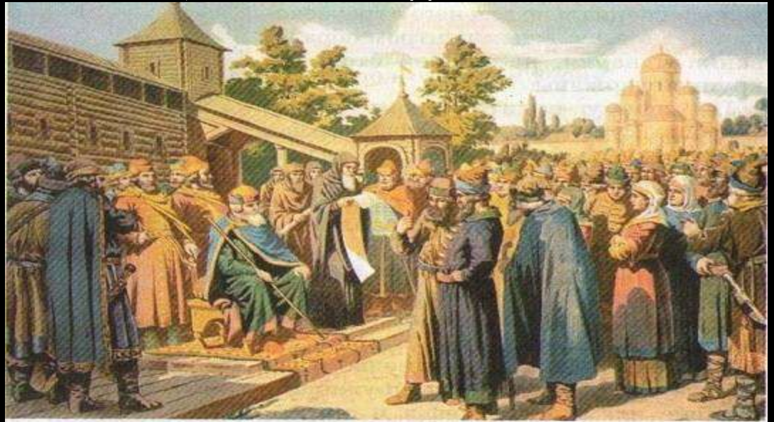
Князь Ярослав Мудрый зачитывает закон народу. Художник А. Д. Корин.

Помощниками великого князя, его вассалами были бояре, члены старшей дружины. Рядом была и младшая дружина, где состояли люди менее знатные, более молодые.