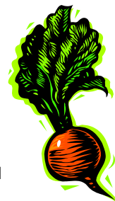
Пояснительная подпись под рисунком.

Lorem ipsum dolor sit amet, consectetur adipiscing elit, sed diam nonummy nibh euismod tincidunt ut laoreet dolore magna aliquam erat volutpat. Ut wisi enim ad minim veniam, quis nostrud exerci tution ullamcorper suscipit lobortis nisl ut aliquip ex ea commodo consequat onsectetuer adipiscing elit, sed diam nonummy nibh euismod tincidunt ut laoreet dolore magna aliquam erat volutpat. Ut wisi enim ad.