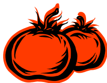
Пояснительная подпись под ри-

Чтобы текст легко читался, используйте дополнительные заголовки.